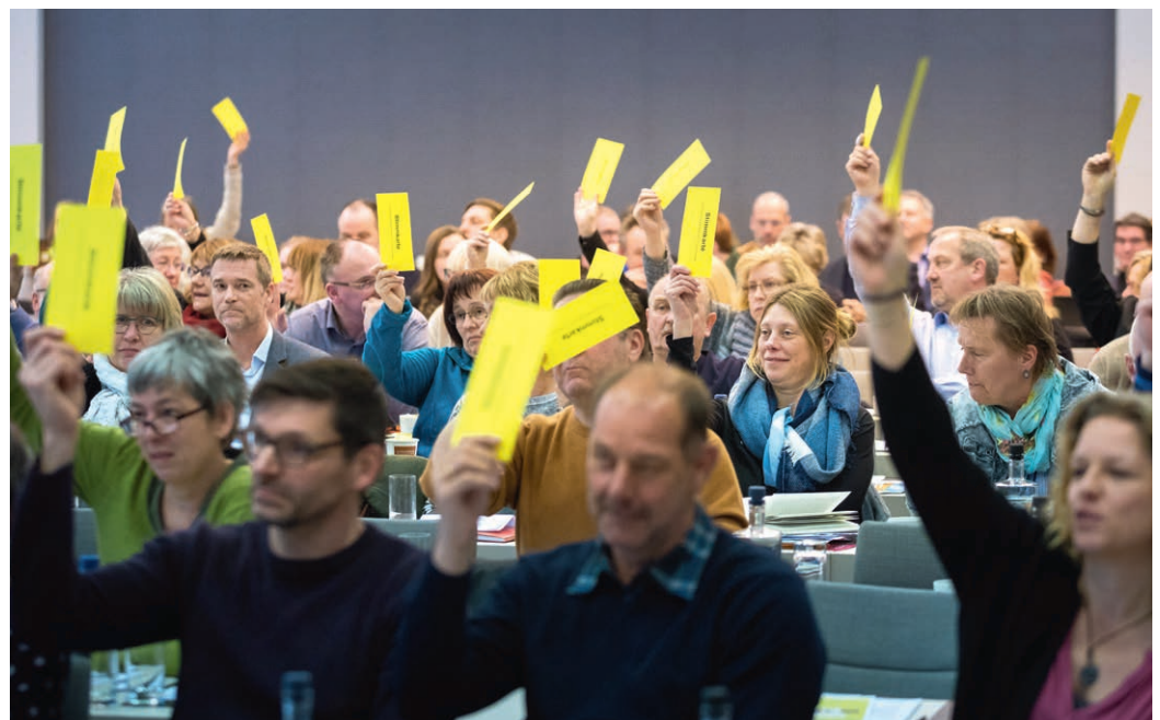
Mehr Geld muss her: Abstimmung der ver.di-Bundestarifkommission in Berlin

Schon seit 2015 nehmen Bund, Länder und Kommunen insgesamt mehr ein, als sie ausge-